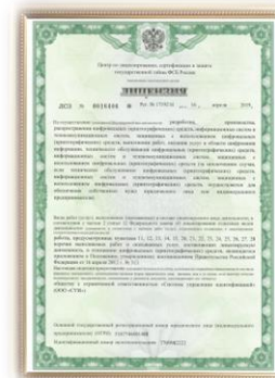
Лицензия ФСБ РФ №0016406 рег.№17192Н от 16.04.2019