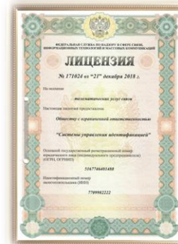
Лицензия Роскомнадзор №171024 от 21.12.2018