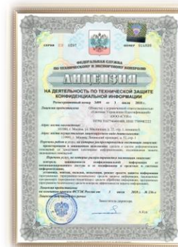
Лицензия ФСТЭК России №3499 от 03.07.2018