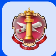
Федеральная нотариальная палата