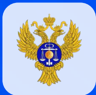
Федеральное казначейство РФ

Более 10-ти успешных внедрений в госсекторе, в том числе: