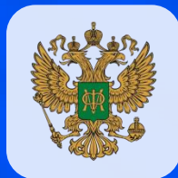
Министерство финансов РФ