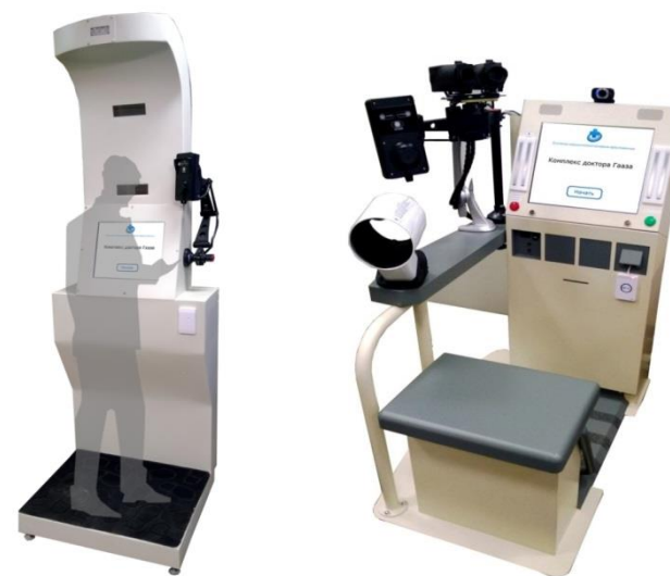
Терминалы медицинской экспресс-диагностики