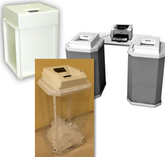
Комплексы обработки избирательных бюллетеней