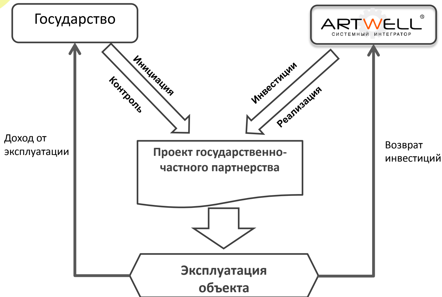
Схема работы по ГЧП