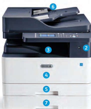
Многофункциональное устройство Xerox® B1025

Конфигурация DADF показана с опциональным дополнительным лотком.