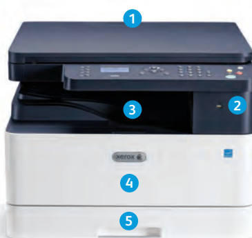
Многофункциональное устройство Xerox® B1022

9 МФУ Xerox® B1025 оснащено цветным сенсорным интерфейсом с диагональю 4,3 дюйма, дополнительно упрощающим работу.