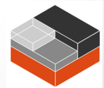
Выбор средств виртуализации